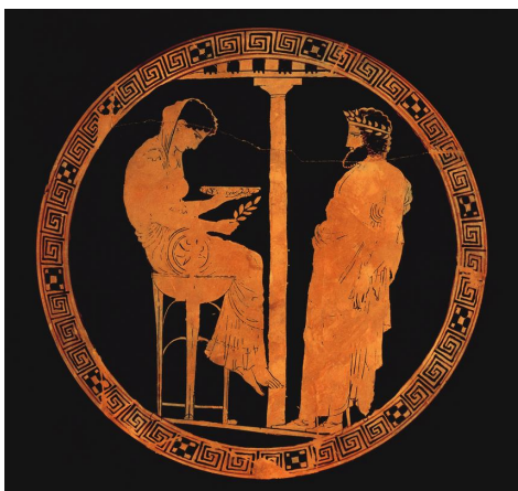
4. A delphoi papnő ábrázolása egy attikai vázán