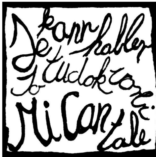
A grafika készítője: Németh Ágnes 10. d